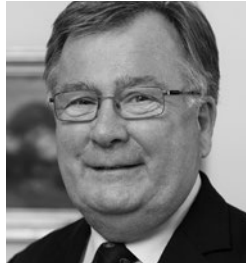
Claus Hjort Frederiksen (V) Finansminister