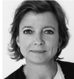
Karen Ellemann (V) Social- og Indenrigsminister