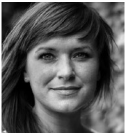
Sophie Løhde (V) Sundheds- og Ældreminister