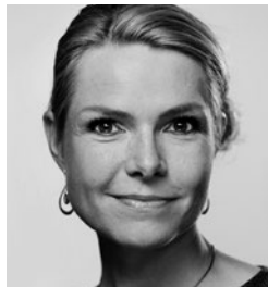
Inger Støjberg (V) Udlændinge, Integrations- og Boligminister